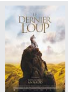
“El último lobo”, Premio del Público al Mejor Largometraje