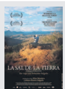
“La Sal de la Tierra” Premio ASECU al Mejor Documental