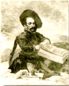
Francisco de Goya Retrato de Diego de Acedo Colección del Instituto

De forma complementaria a las exposiciones permanentes durante esta semana podremos visitar en la sala del claustro principal, en la planta baja, la exposición El Patrimonio Educativo de los Institutos Históricos , que propone una muestra de aquellas piezas que no se encuentran ex-